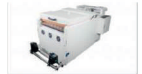
High Power Drying