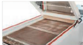
Mesh Belt Drying