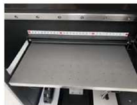
Plataforma de succión de alta precisión (planitud de 0,1 mm)