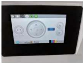
Panel de pantalla táctil de fácil manejo