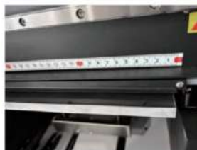
Plataforma con regla, fácil de