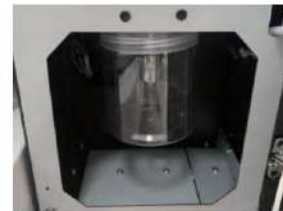
Tanque de tinta residual lleno sensor