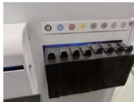
Cartuchos de tinta recargables con sensor de falta de tinta