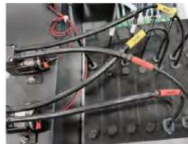
Tanques de tinta blanca con 2 motores de circulación