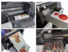
Botella, cama plana, película en rollo y UV La película DTF ambienta el origen del inicio