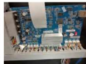
Adoptando el famoso tablero Hoson